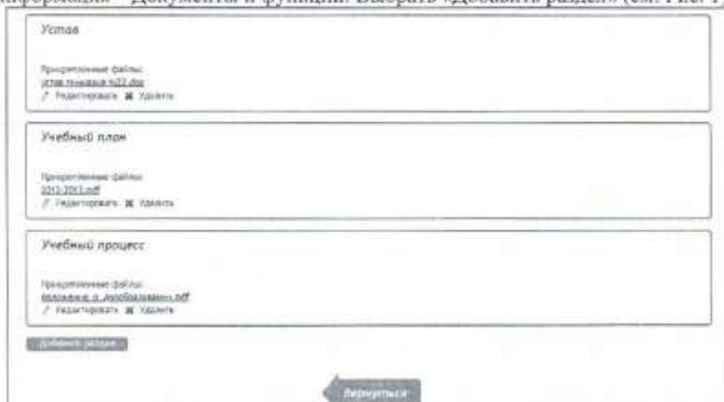
Рис. 1. Добавление нового раздела.

1. На странице школы перейти в Редактировать данные – Общая информация – Документы и функции. Выбрать «Добавить раздел» (см. Рис. 1)